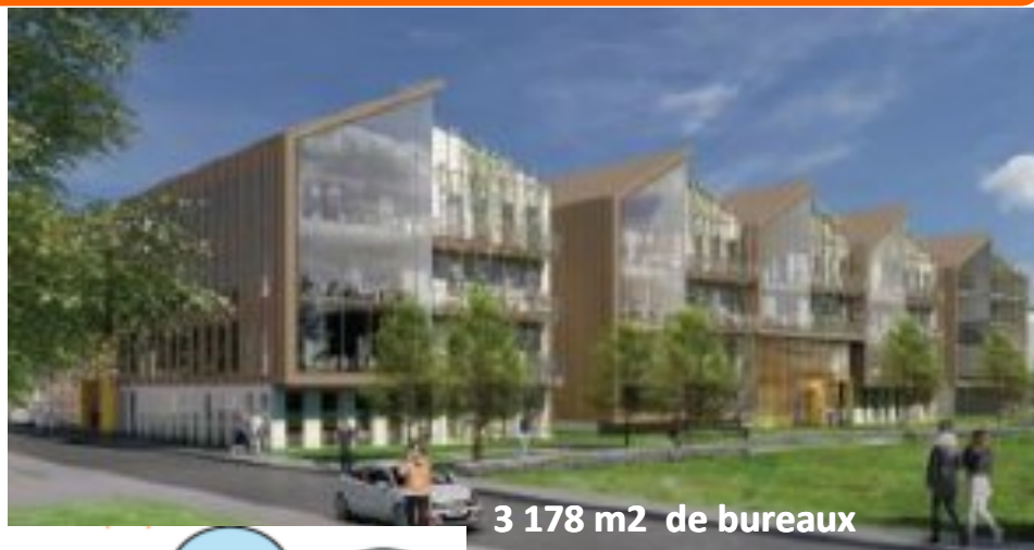
3 178 m 2 de bureaux